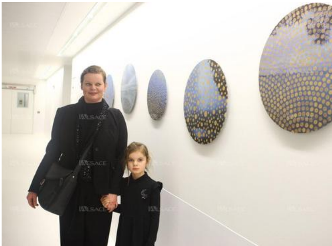
Les œuvres de Sophie Sommerlatt explorent le rond, comme un hymne à la vie.